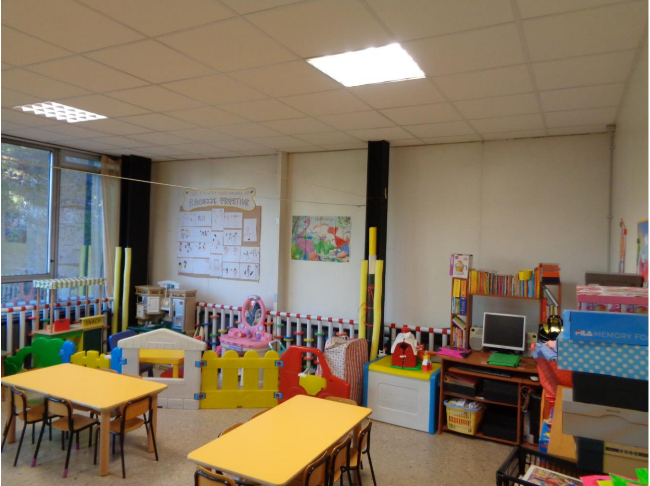
Figura 11 Allegato B_DE_Lotto.6-E0827_foto 11