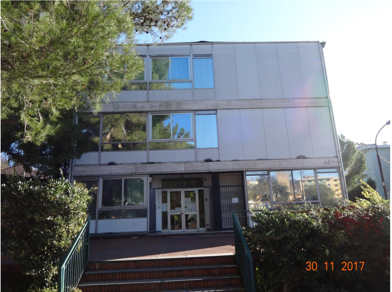
Figura 1 Allegato B_DE_Lotto.6-E0827_foto 1