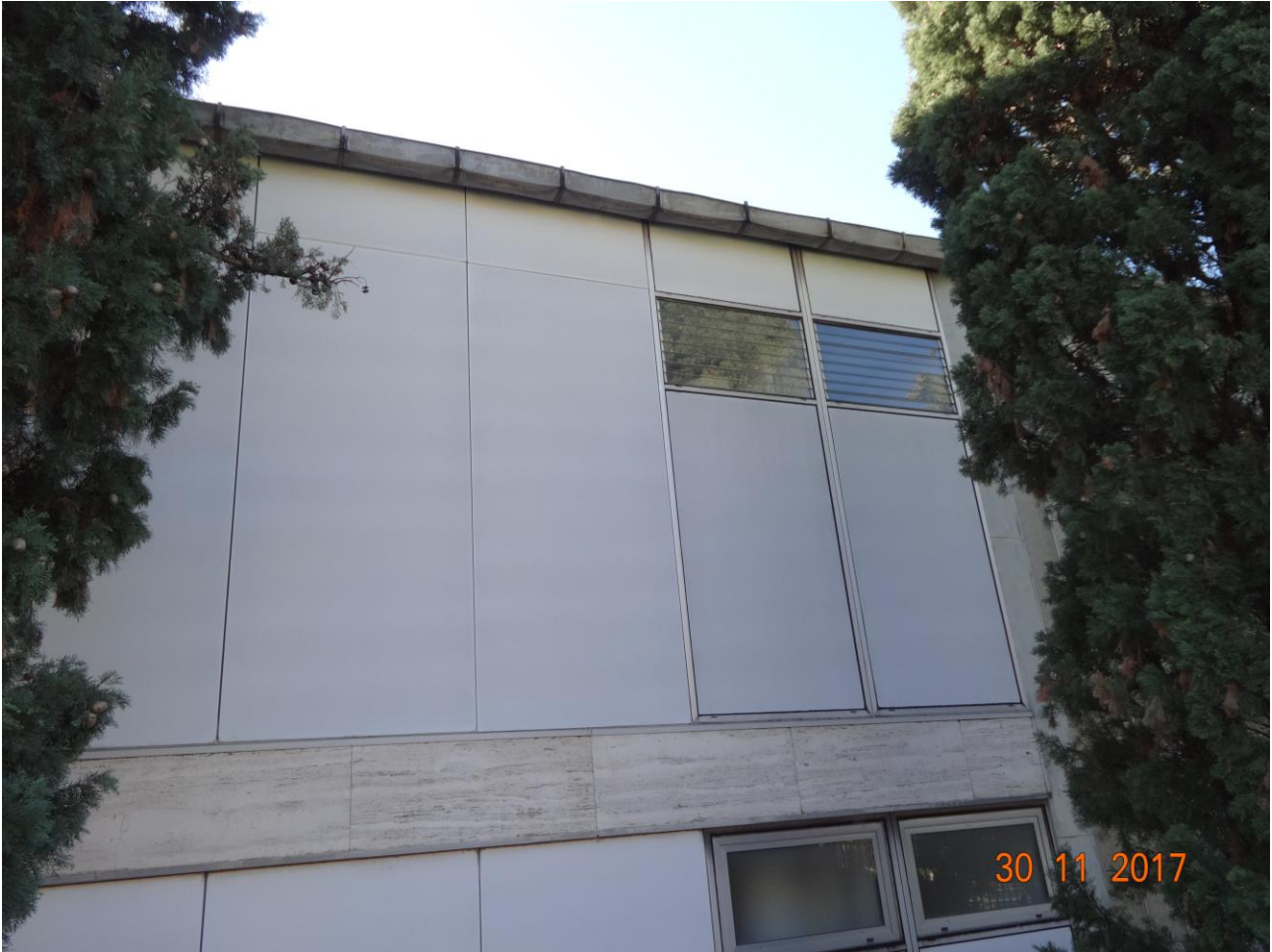
Figura 2 Allegato B_DE_Lotto.6-E0827_foto 2