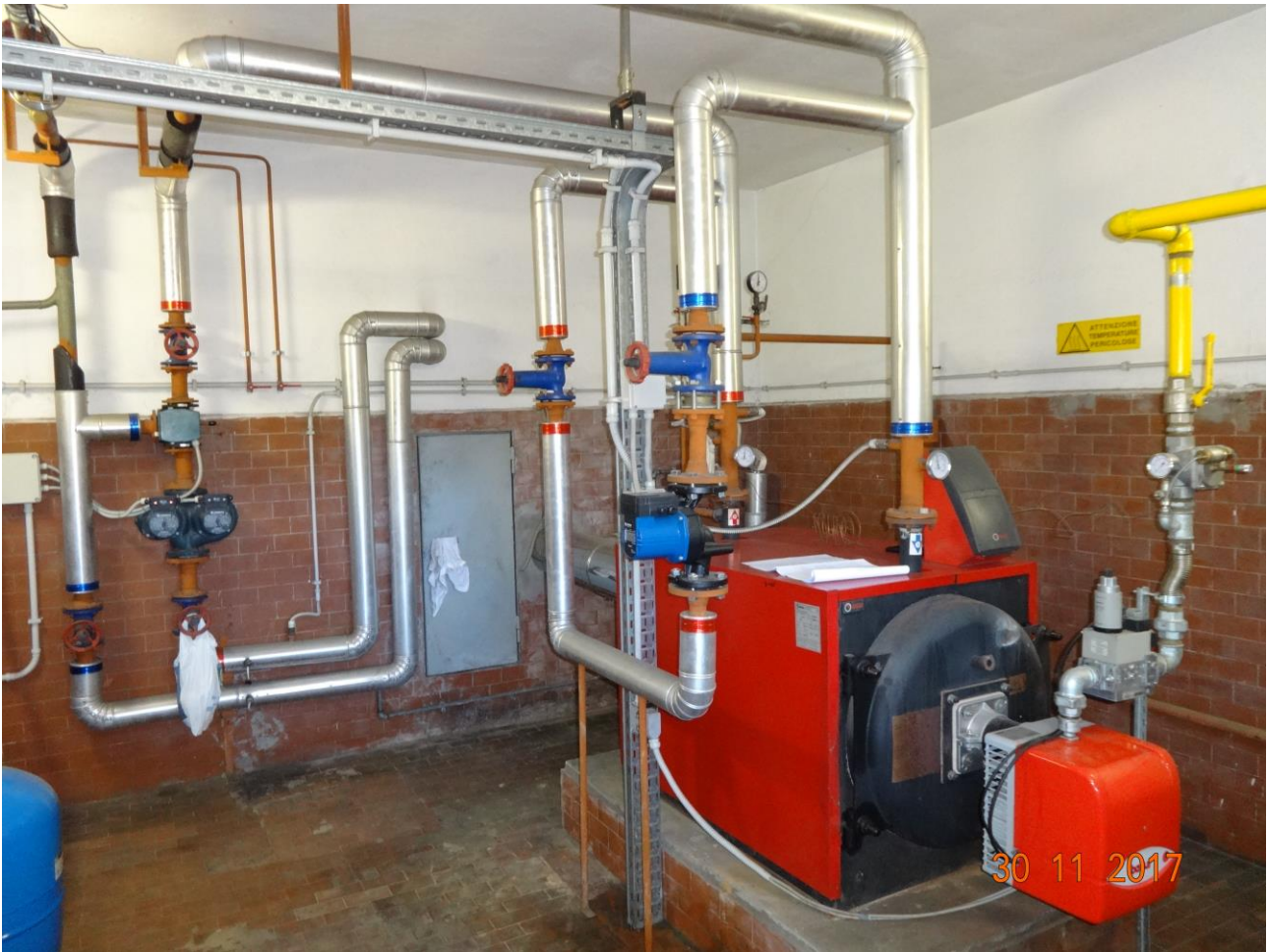
Figura 7 Allegato B_DE_Lotto.6-E0827_foto 7