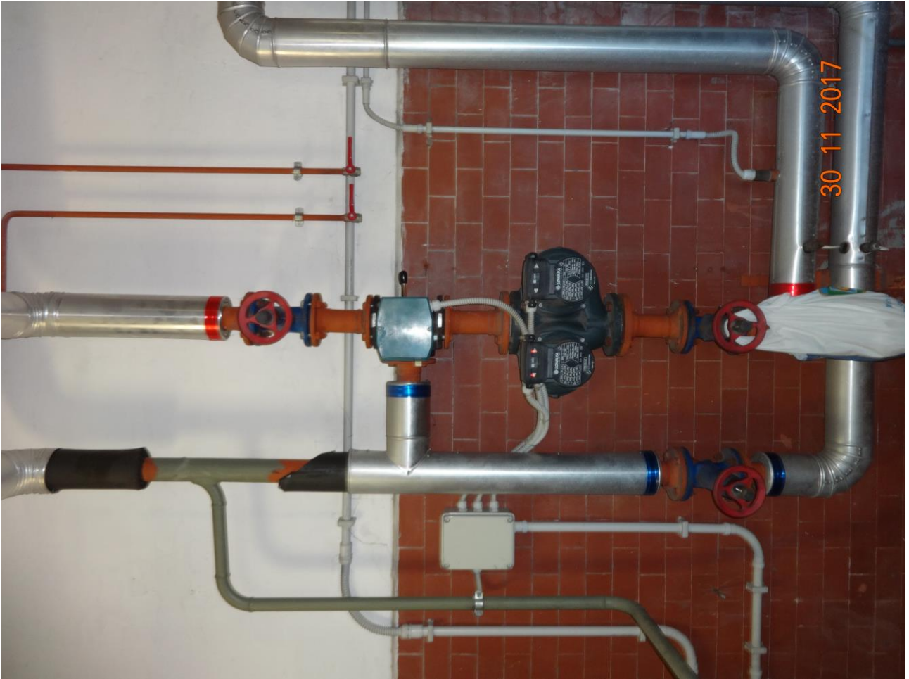
Figura 6 Allegato B_DE_Lotto.6-E0827_foto 6