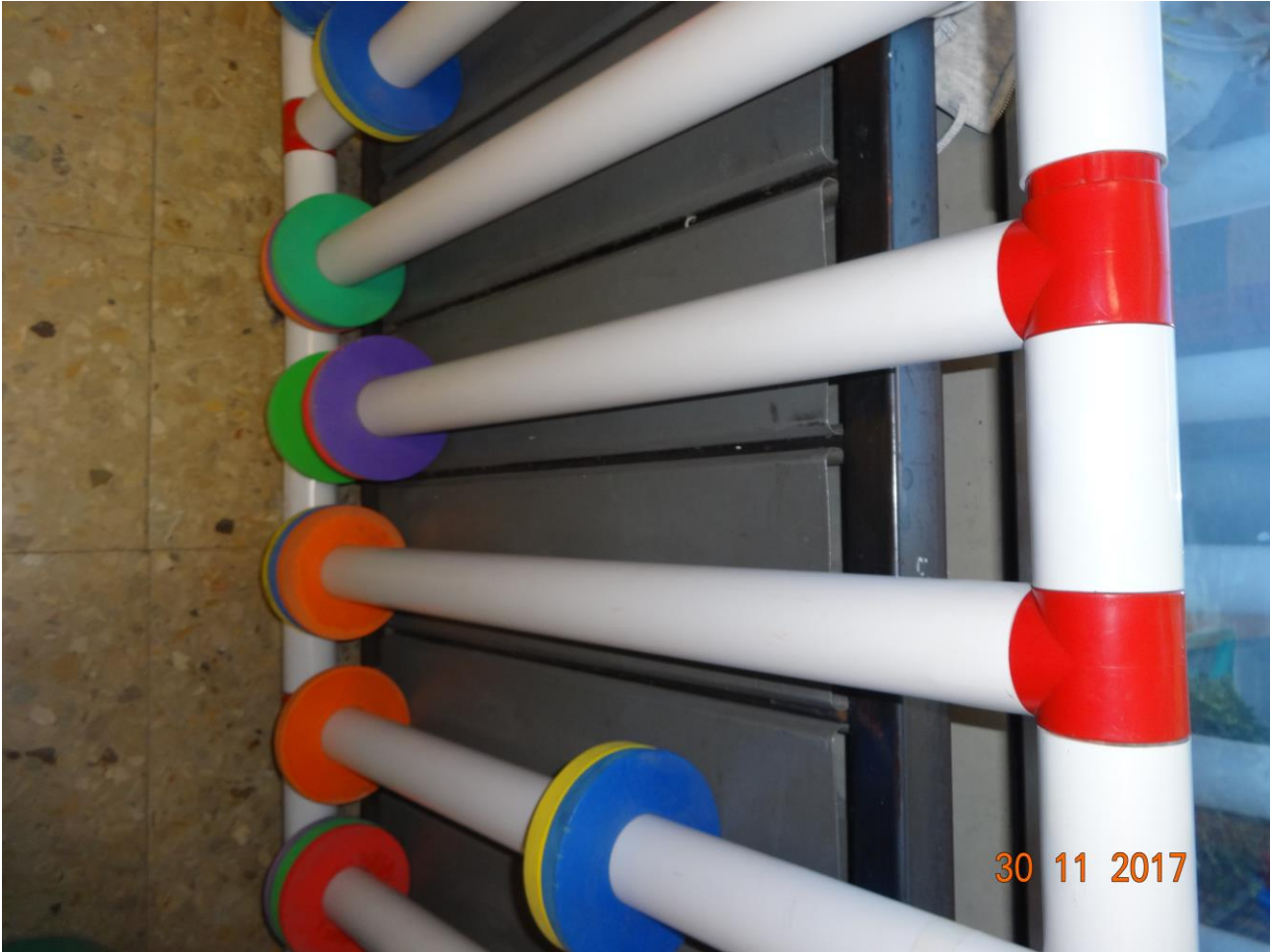
Figura 4 Allegato B_DE_Lotto.6-E0827_foto 4