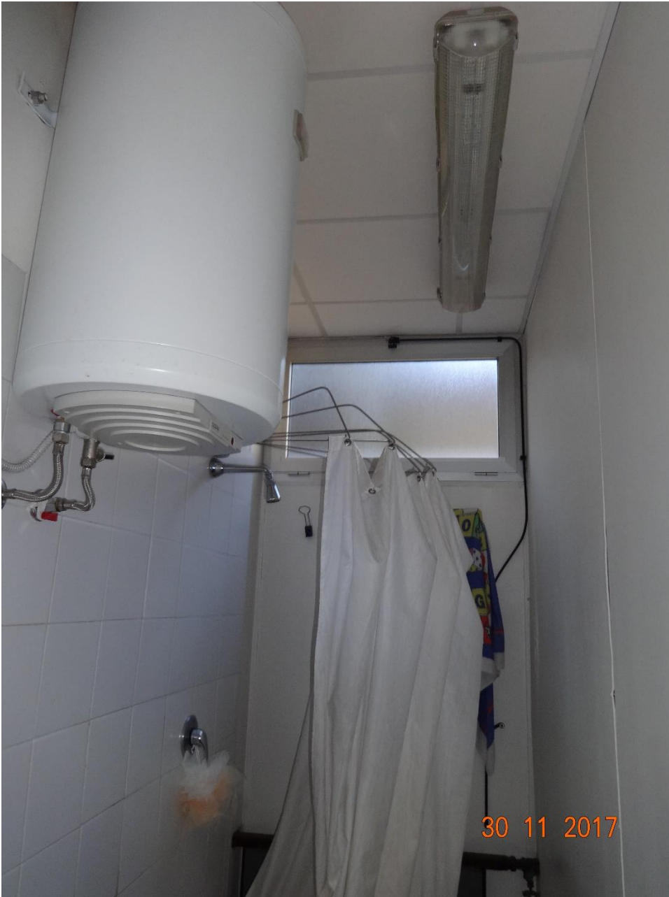
Figura 10 Allegato B_DE_Lotto.6-E0827_foto 10