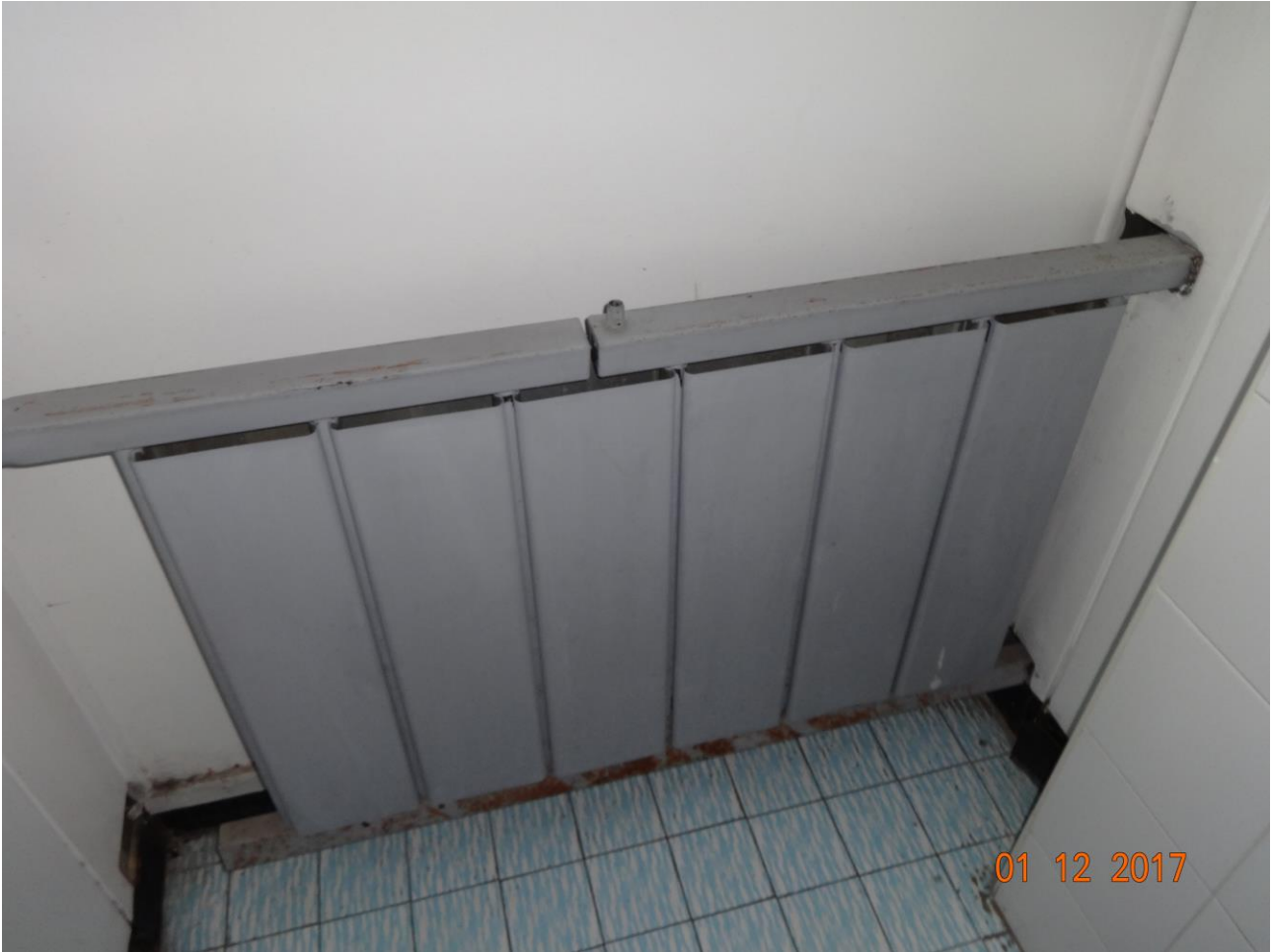
Figura 5 Allegato B_DE_Lotto.6-E0827_foto 5