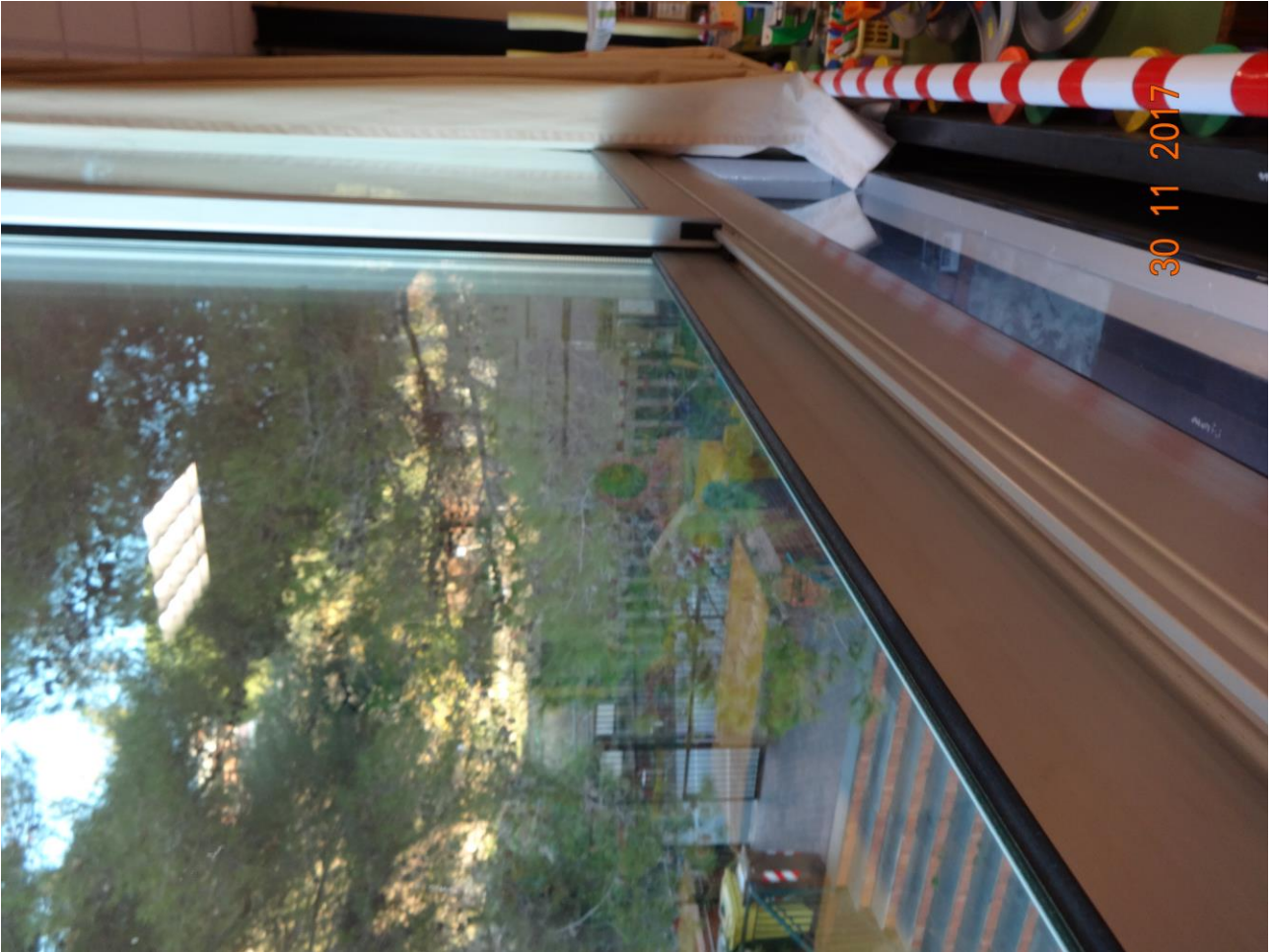
Figura 3 Allegato B_DE_Lotto.6-E0827_foto 3