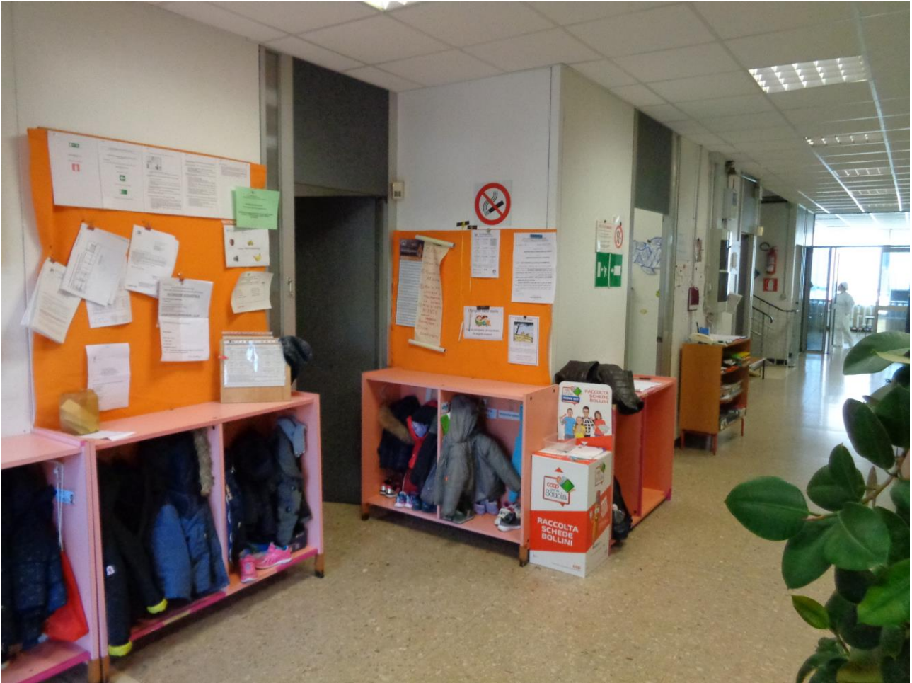
Figura 13 Allegato B_DE_Lotto.6-E0827_foto 13