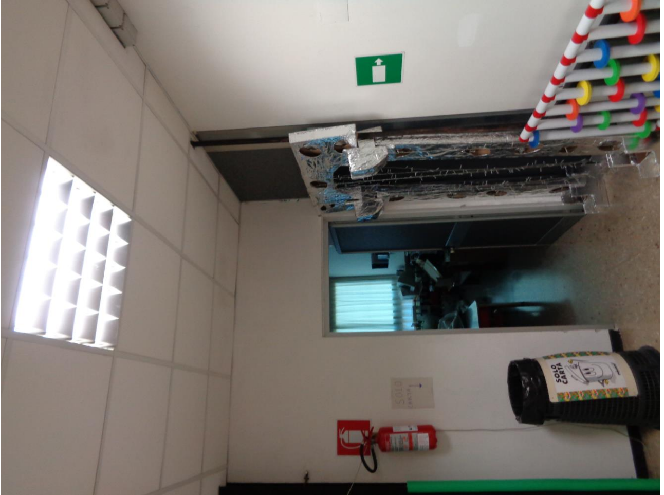
Figura 12 Allegato B_DE_Lotto.6-E0827_foto 12